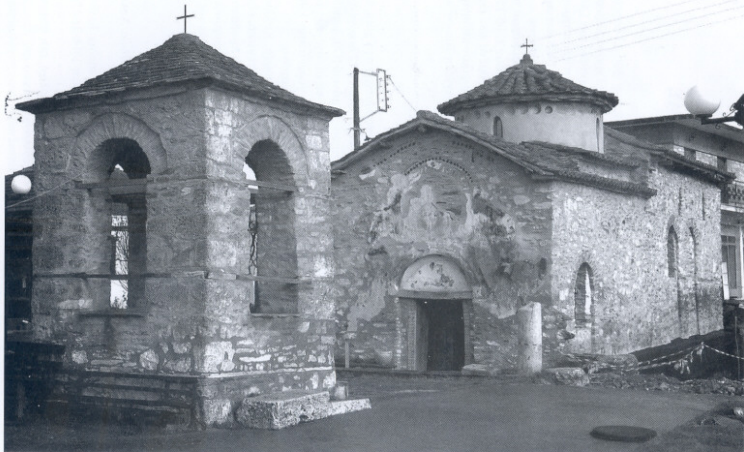
Εικ. 1. Δολίχη. Ο ναός της Μεταμόρφωσης του Σωτήρος, ο οποίος ανεγέρθηκε εκ βάθρων το έτος 1516.